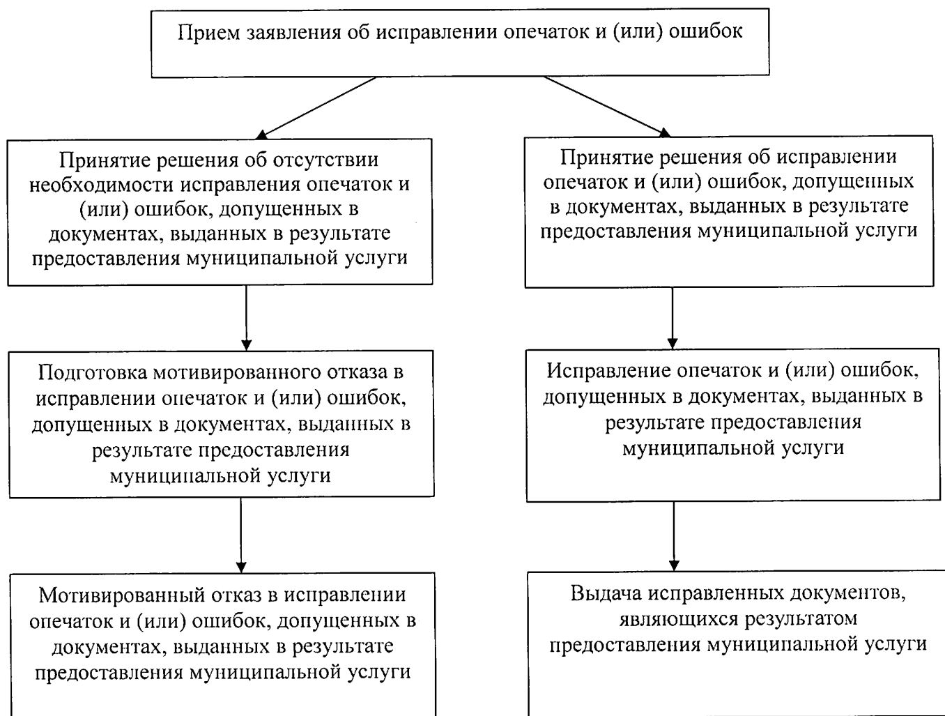
Блок-схема исправления допущенных опечаток и (или) ошибок в выданных в результате предоставления муниципальной услуги документах